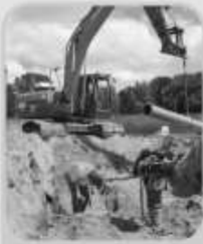
CIVIEL & INFRA

De kwaliteit van de bodem kan worden bepaald door o.a. een partijkering of milieukundig bodemonderzoek. Tevens zijn wij totaalverantwoordelijk voor de uitvoering en begeleiding van een bodemsanering.