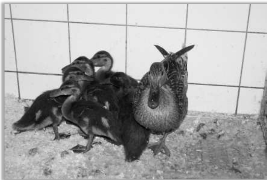
Deze moedereend met 8 pijltjes komt uit Leidschendam. De moeder heeft een breuk aan haar poot.